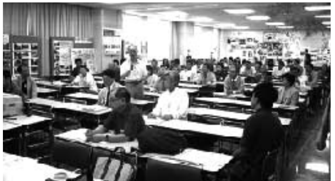
今年6月に開催したまちづくりビジョンフォーラムの様子