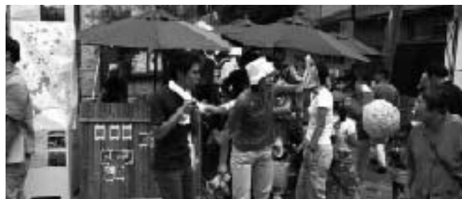
区民祭では高津産の野菜をアピール

高津に火をつける!! (仮称)若者部会 30歳未満の若者が集まって高津区のまちづくりについて考えています。「高津の火付け役」となるべく、まちの活性化へ向け多彩なテーマで外へ向けた活動を行っています(キラリデッキでのまちづくりアンケート実施、区民祭での高津の産業紹介など)。随時メンバー募集しています。皆さんの一歩が高津を動かします!