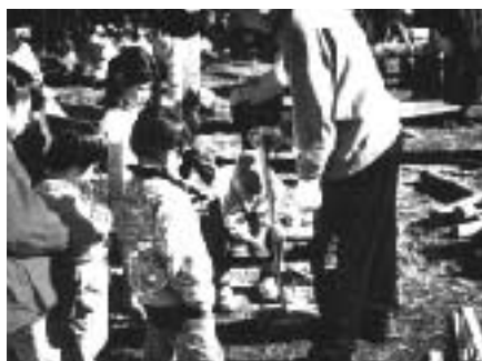
昨年冬に行われた竹炭づくり教室

高津区市民健康の森を育てる会 里山環境を将来にわたり保全・育成をし、自然環境の学習や地域コミュニティの場として、人と自然との共生を図りながら、管理・運営を行うことを目的とし、定常的な活動とイベント的な活動にわけて活動しております。定常的な活動では、森の具体的な維持管理活動として、定期的な現地作業の他、植生調査、自然観察会の他、生息環境整備などの活動を行います。イベント的な活動では、森での活動をより実り多く楽しくするために、季節に応じての活動が計画・提案されています。