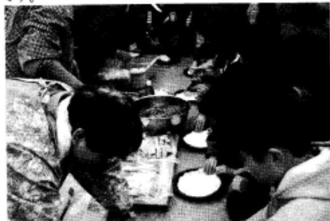
生地ベタベタ。香ばしいピザをつくらっと！

作業は、孟宗竹の伐採にはじまり、竹割、窯づめ、窯出しなどでした。又、子ども達による「ピザづくり」と「火おこし」の体験も行われました。小さな手で生地をのばして、具の盛り付けをする子ども達の生き生きとした表情、我が子をカメラに収めるお母さん。竹炭教室は、ひととひと、人と自然がふれあう場所です。