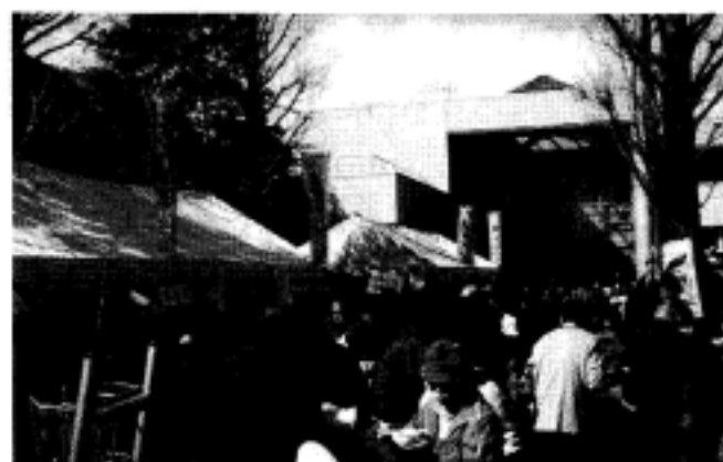
大勢の人で賑わった図書館前の物産市

大山街道の活性化を目指して昨年誕生した『大山街道活性化推進協議会』は、一年間の研究討議をへて、2月15日高津図書館前広場(溝口緑地)、大山街道ふるさと館をメイン会場に、5000人を超える区民が来場し、盛大に行われました。図書館前では、「益子焼」販売や、「高津豆腐」製作販売、フリー・マーケットが出ました。「大山街道ふるさと館」では、舞踊、落語、日本民芸館館長三輪修三氏の講演も行われました。また常設展示場では、大山街道の賑わい展が開かれ、大山街道を訪れた文化人や、信仰の道を追慕しました。