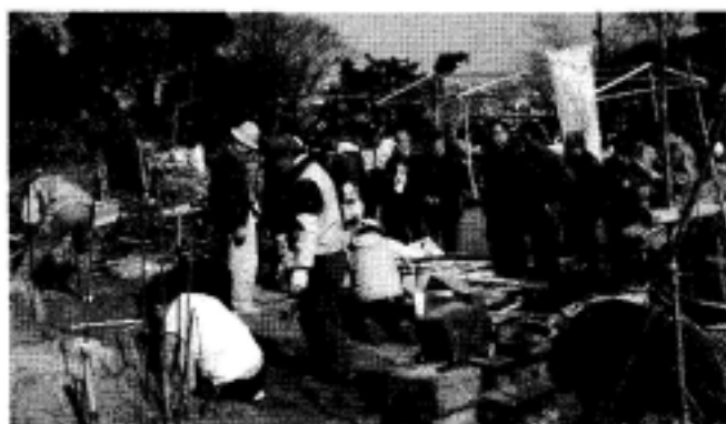
「高津区を知る」市民健康の森グループ