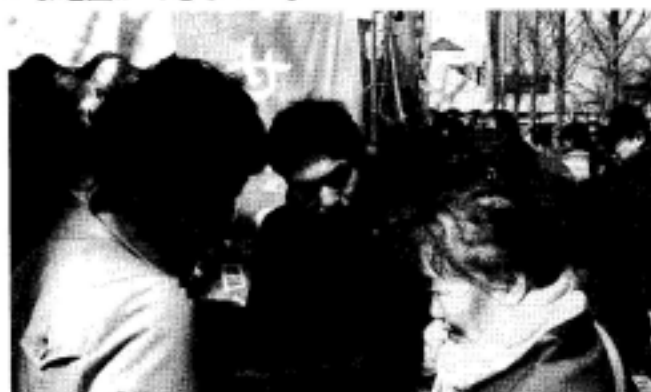
大山街道フェスタでのアンケート風景

若者部会の正式名称を「SAI22」(さいにんにん)に決定しました。「SAI」はSalon Artistique et Intelligentの略で「知性的かつ美的感覚なサロン」という意味です。知性的で美的感覚に溢れるまちづくりを目指します。「SAI」にはその他「彩・祭・才」の3つの意味も込めています。また「22」には「22世紀を見据えたまちづくりを考える」という意気込みを表しています。SAI22は2月13日から15日、市民自治創造かわさきフォーラムと大山街道フェスタに参加し、パネル展示、季刊ニュースの配布と共に「高津の色って何色？」アンケートを行い、215通の回答を得ました。自分の住んでいる家の周辺等を色に例えると何色かを選んでもらい、それを高津区の地図上に落としカラフルな地図ができました。