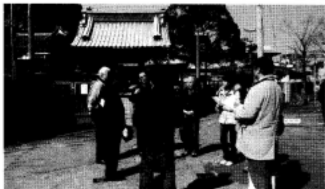
「高津区を知る」大山街道・戴めぐりグループ