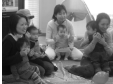
いちごママくらぶ、フリールーム

私たちは、平成15(いちご)年生まれの幼児がいる母親の子育てグループです。昼間、コム・ちどりの