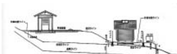
計画の一例：シェルターと炭焼き小屋