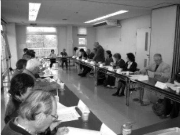
3月18日の利用者の会