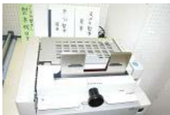
強力で使いやすい製本機

クラブやサークルで報告書や文集、作品集や歌集などを作る際、これまではホッチキス止めができる薄い物に限られ、分厚いと専門業者に頼んでいたのではな