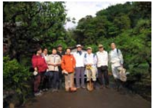
作業が終わって、みんないっしょ

緑部会 URL http://www.city.kawasaki.jp/67/67kusei/home/kumin/kyougikai/midori/midori_top.htm