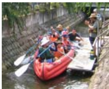
昨年のニヶ領用水ボートの様子

昨年も大好評だったこの企画。ニヶ領用水のほとりを歩いて癒されていた人も、学校で勉強していたけど実際にどれがニヶ領用水なのか分からなかった人も、この日はいつもより近い距離でニヶ領用水を眺めてみませんか?そして、この高津区民祭に備え