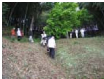
斜面は竹の落ち葉に覆われて

です。来年以降の管理計画が待たれるところですが、高津区まちづくり協議会・緑部会は、いち早く緑地保全の活動のために、ここに入りました。