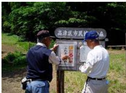
案内板の取り付け

の1年間の努力の結晶です。橘小学校の生徒達もホタルの飼育に取り組みことになりました。