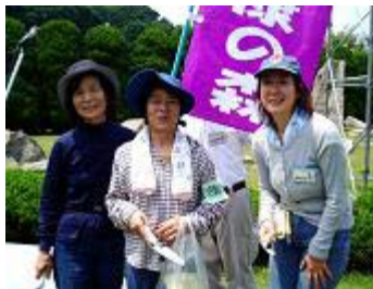
私達も植えました

6月5日(日) 市主催、「世界環境デーに1万本植樹・市民が進める森づくり」に「森」のメンバー22人が参加。市宮緑ヶ丘霊園内の空