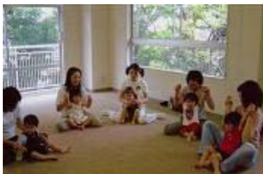
子どもたちといっしょにストレッチ

親子でストレッチをする集いです。家事に育児に仕事にと毎日奮闘中のママさんたち。楽しいことばかりじゃありません、時に疲れる、ストレ