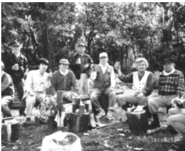
竹でつくったコップで乾杯！！