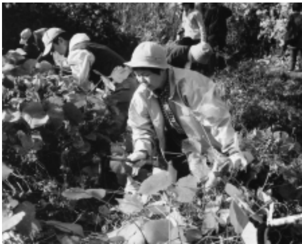
みんなで下草刈り（平成 13 年 11 月）

「高津区市民健康の森」の用地を選定した「構想検討委員会」を引き継ぎ、市民健康の森を文字通り「市民」のものとするための「高津区市民健康の森推進委員会」の活動が始まっています。「どんな森にしようか?」「どんな木を植えていこうか?」など新しく委員になられた方々と共に、基本コンセプトにもあるとおり「ゆっくり、みんなで、たのしみながら」進めています。