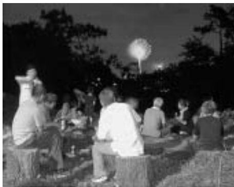
多摩川の花火を観る

にまみれながら行いました。8月17日には多摩川の花火を観る会が催され、夏の一夜を楽しく過ごしました。