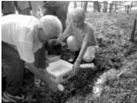
ホタルの幼虫を放流