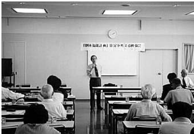
「地域福祉計画」を考える勉強会