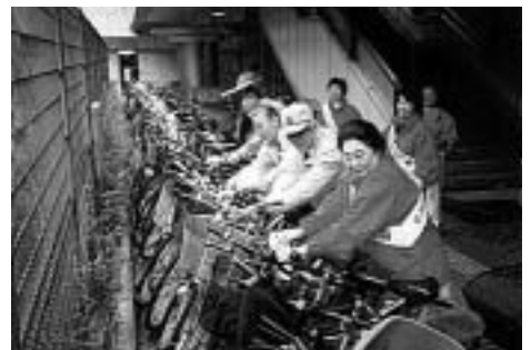
放置自転車追放キャンペーン

駅近くの人 は自転車等 の利用を控 えるなどご 理解とご協 力をお願い いたします。