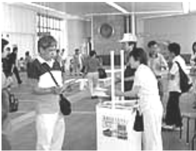
「ももちゃん」販売のようす

まだ「高津のももちゃん」をお持ちでない方は、ぜひ一度手にとって見てみてください。本の中には高津の魅力があふれています。きっと買わずにはいられなくなることでしょう。