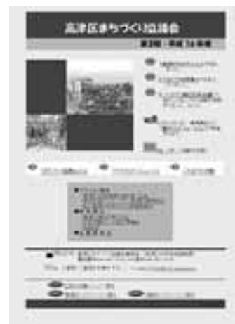
まちづくり協議会トップページ

各委員会・部会のページは内容を更に充実し、関連する活動や組織へのリンクも増やしました。また、新たに活動を開始した「区民活動ルーム」のに関するページを新設しました。協議会のトップページも新画面とし、季節ごとの色彩を基調にして行く予定です。