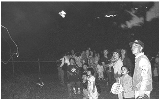
ホタルの舞いに感動！

今、市民健康の森では、じゃが芋、里芋、玉ネギ、シイタケ等の栽培のかたわら、カブトムシの幼虫も飼育しています。5月30日にはサツマイモの苗を100本程、植付けしました。