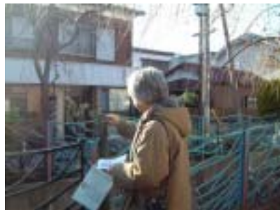
どんな色に投票しようかな

小学校からの帰り道、棒を拾ってガードレールやフェンスを鳴らしながら帰ったというのは、誰にでもある思い出の風景。そんなお気に入りのフェンスのある風景が、ニヶ領用水沿いに新たに生まれます。