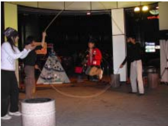
ダブルダッチに初挑戦し楽しむ子供の様子

色とりどりの光の演出の中で在日本朝鮮青年同盟の有志によるコーラスとサンフラワーズガーデン、AST、little mといったヤングミュージシャンの演奏が行われ、広場を通る人々が聞こえてくる演奏に足を止め、耳を傾けていました。